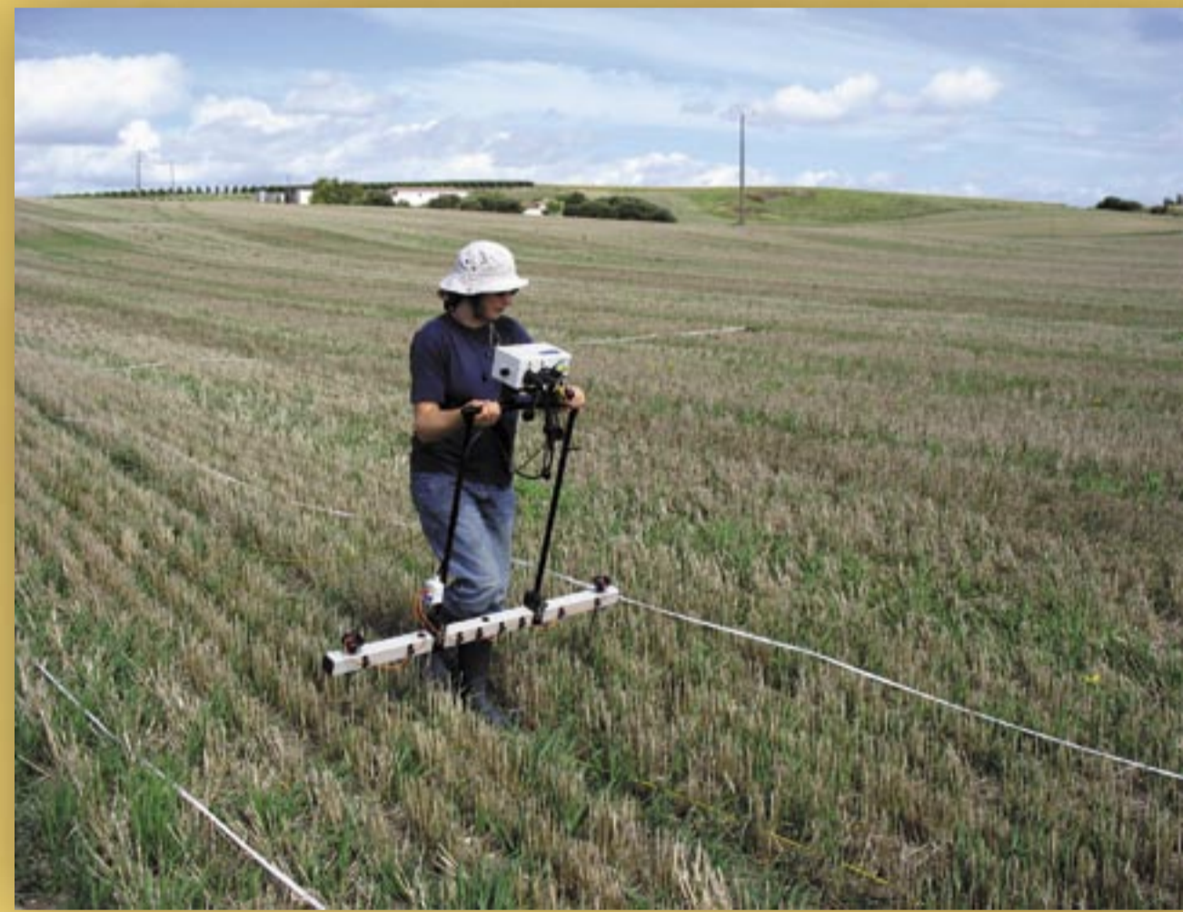
Prospection géophysique, 2006