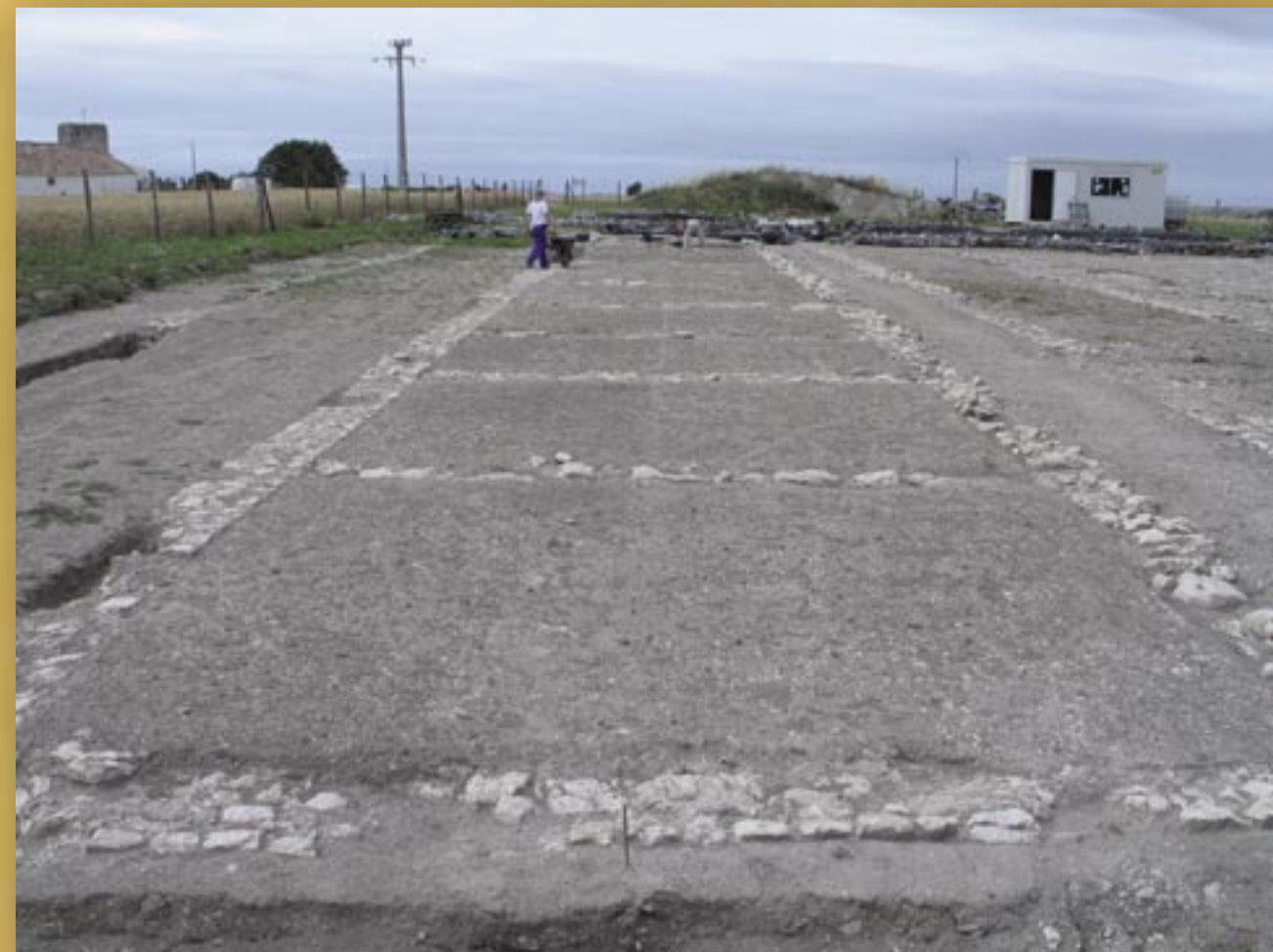
Horrea - Fouille Alain Bouet

1998-2002, Alain Bouet. Découverte majeure : l'alimentation en eau (puits et mécanisme).