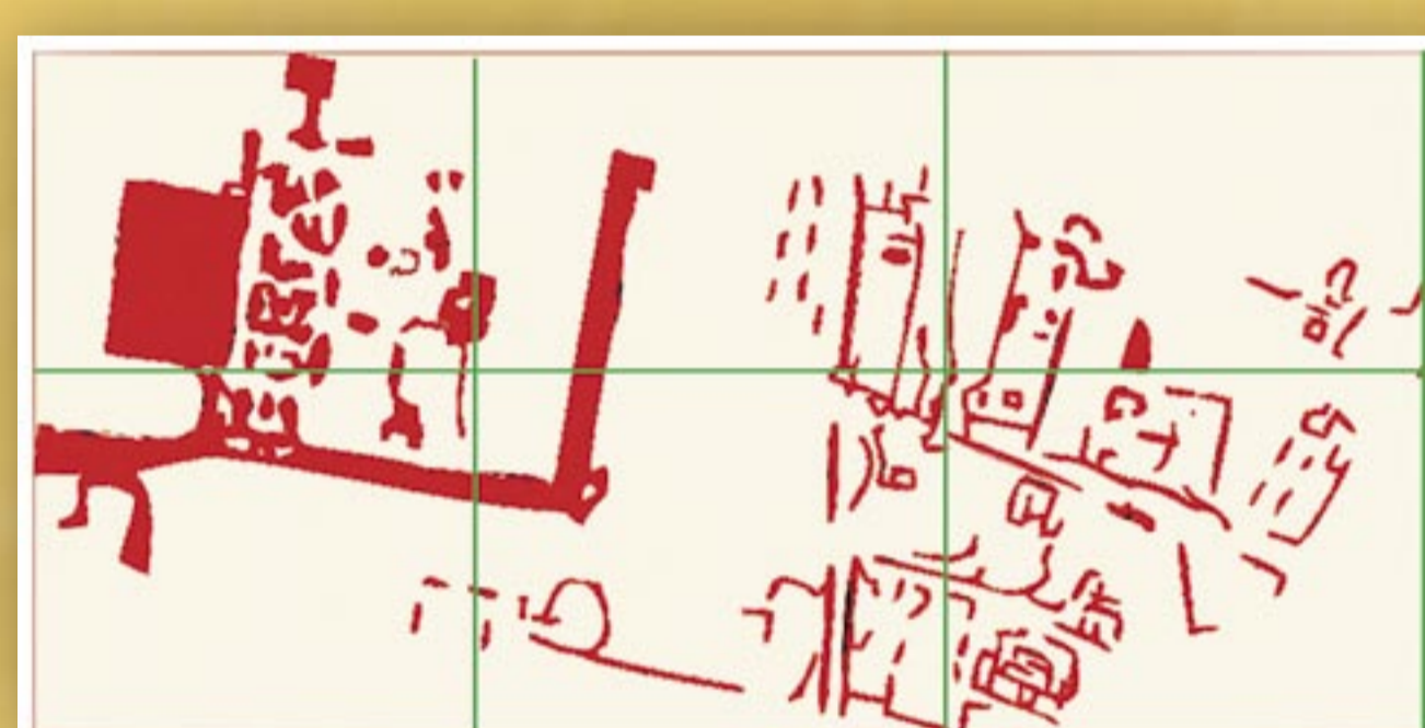
Prospection géophysique, 1998