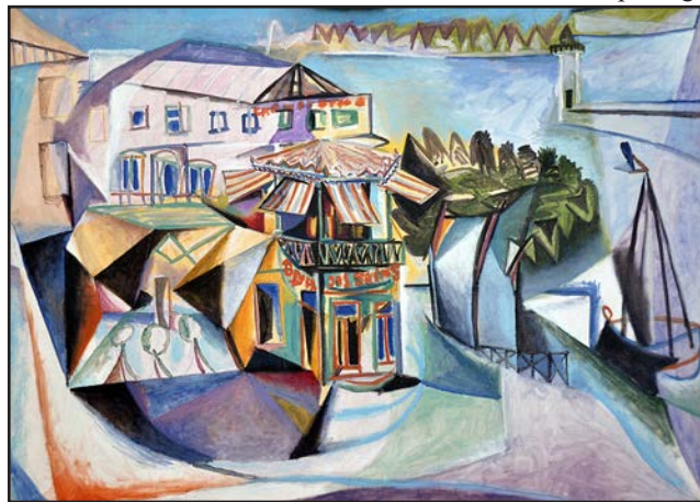
Café à Royan - 1940 - Huile sur toile

Cette exposition de fac-similés est l'occasion unique de présenter en un seul lieu les œuvres réalisées à Royan et conservées dans des collections prestigieuses : musées Picasso de Paris, de