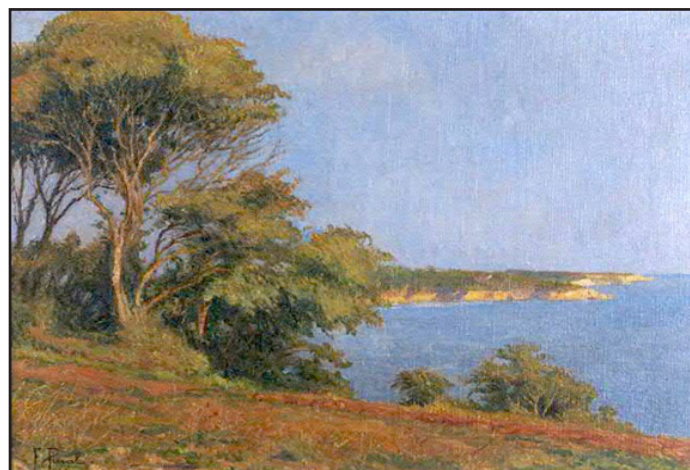
La pointe de Suzac, huile sur toile

Une rétrospective de son œuvre a été réalisée en 1994 au musée Bossuet de Meaux.