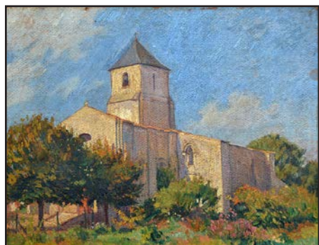
L'église Saint-Pierre, 1930, huile sur carton