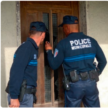
▲ En intervention chez un particulier