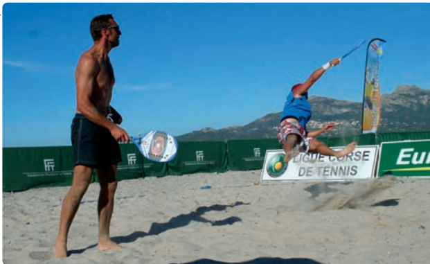
▲ Double en action sur la plage de Calvi