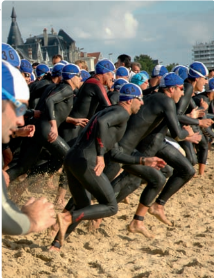
▲ Les nageurs s'élancent sur la plage de la Grande Conche

La 11 e édition du Triathlon de Royan qui a eu lieu le samedi 25 septembre 2010, a été une très belle fête du triple effort et une grande réussite, tant sur le plan sportif qu'au niveau de l'organisation.