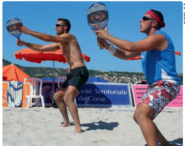
▲ Concentration maximale avant l'engagement