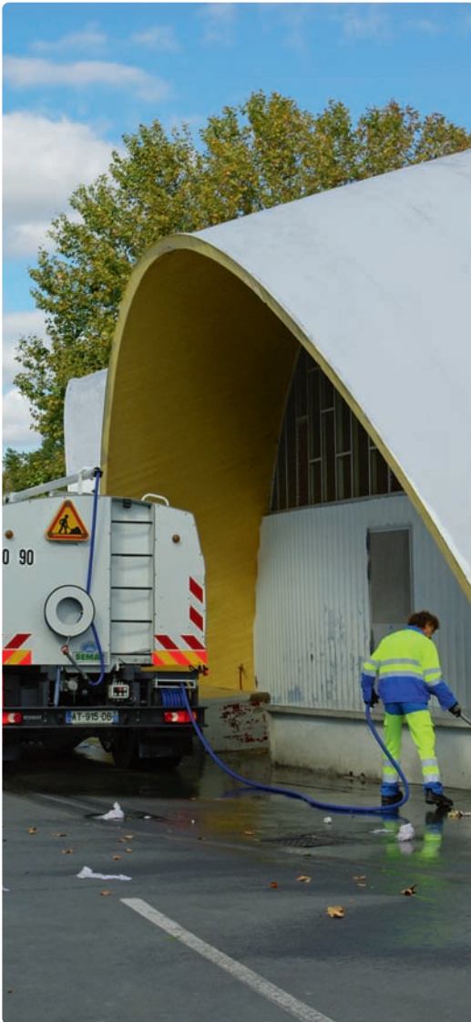
Une équipe du nettoyage en action autour du marché ▲