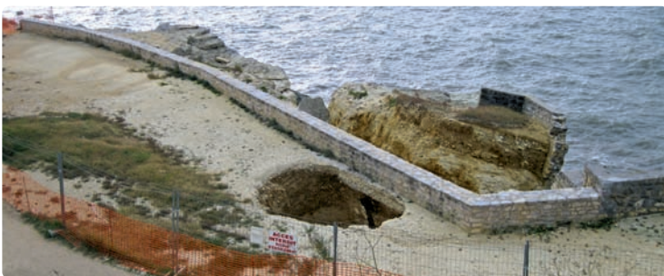
▲ Un chantier urgent et nécessaire