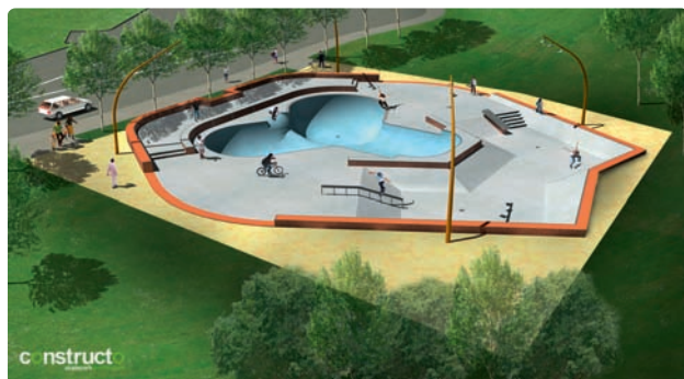
◀ 1 ère esquisse du futur skate park de Royan

Pour rester en lien constant et direct avec la jeunesse, une revue verra le jour, dès janvier 2011, et sera intitulée : « KOI2 9 ? ». D’ores et déjà, 16 rendez-vous sont programmés, soit un événement tous les 15 jours. À cet égard, afin d’assurer, tout au long de l’année, la pérennité de ces actions, la commune a décidé de restructurer le service municipal, en mettant en place un véritable service Animation-Jeunesse, avec pour mot d’ordre : « Royan, faut que ça bouge ! » ■