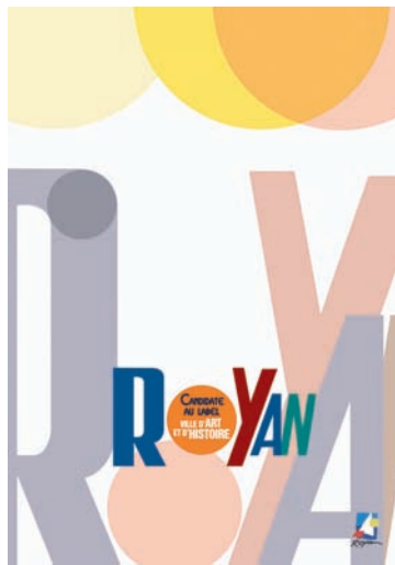
▲ Couverture du dossier « Ville d'Art et d'Histoire »

Un chantier palpitant nous attend et nous remercions chaleureusement celles et ceux qui se sont déjà investis à nos côtés. Rendez-vous en 2011, avec notre nouvelle « Ville d'Art et d'Histoire ! » ■