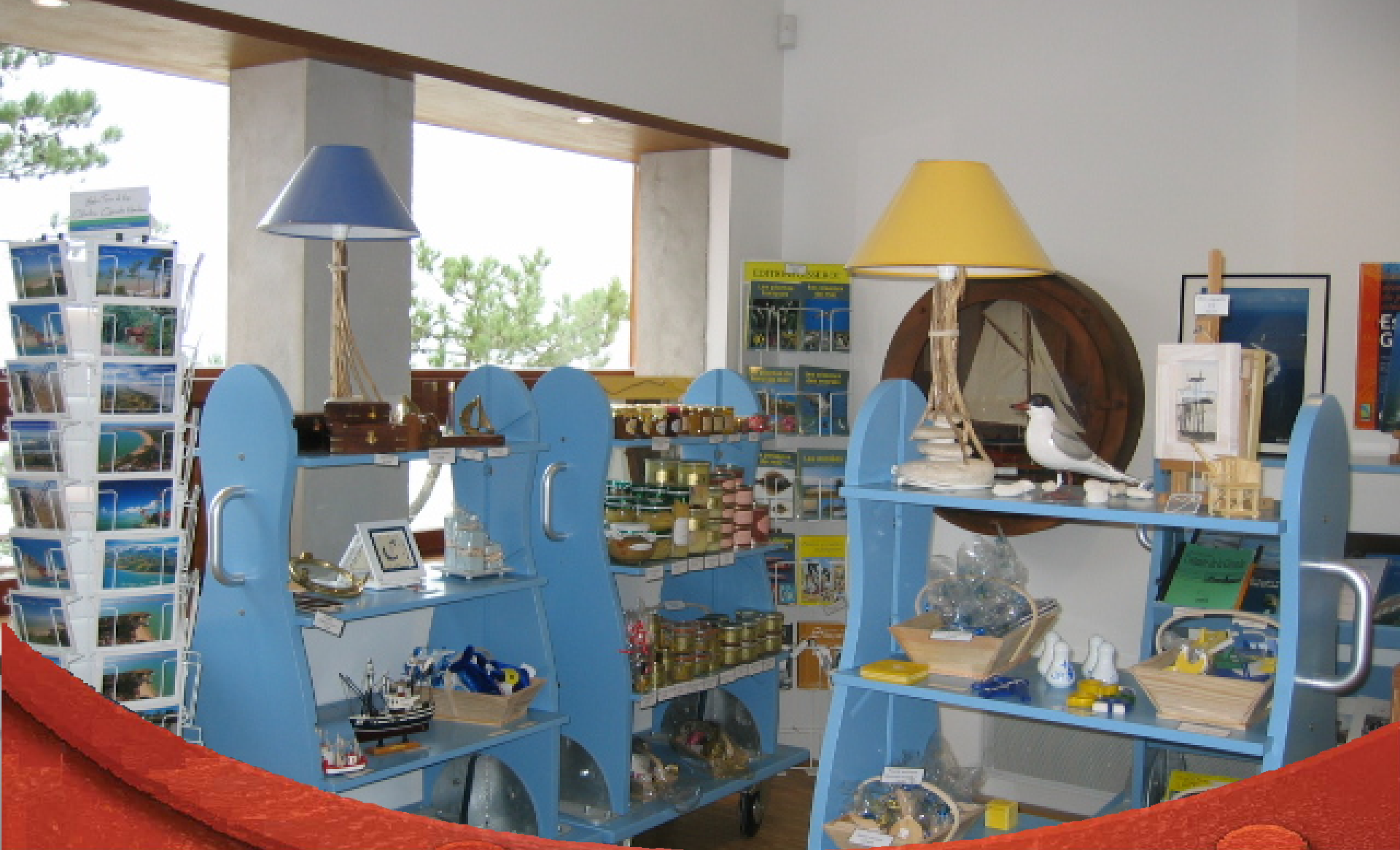
La boutique du parc...