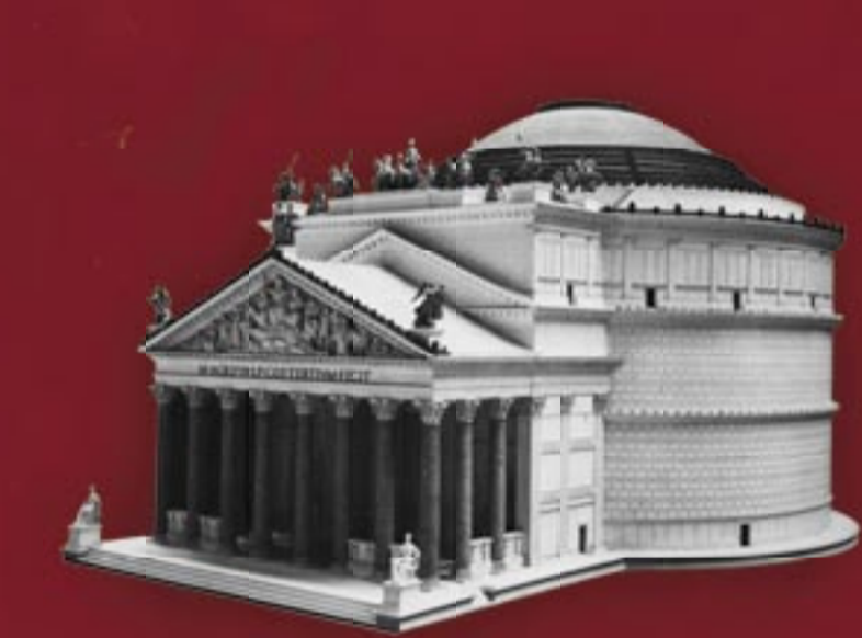
Panthéon - Rome

« Le temple a exactement la même forme et à peu près les mêmes dimensions que le Panthéon d'Agrippa à Rome » (abbé Julien-Laferrière).