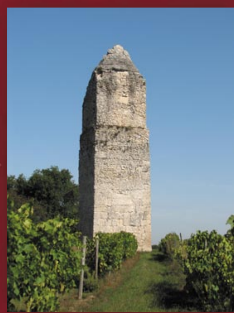
Pile romaine de Pirelonge St-Romain de Benêt -17