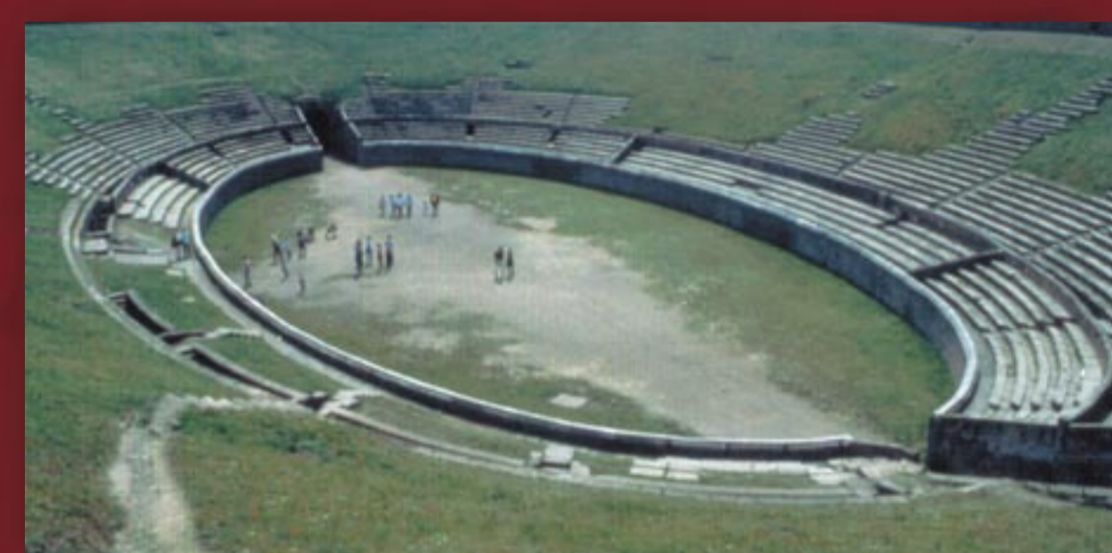
Amphithéâtre de Pompéi

- « ...vers le sommet de la montagne de la hauteur de la Garde... il paraissait encore en 1708 les vestiges d'un château que l'on croit être véritablement les fondations d'un cirque parce que l'on voit... que c'était une figure ovale » (Claude Masse).